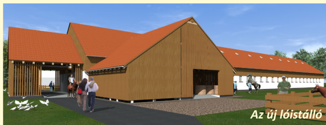
Az új lóistálló

A KRAFT program keretében elnyert támogatásból új gépekkel megújult tangazdaság, új lóistálló biztosítja a korszerű szakképzés feltételeit!